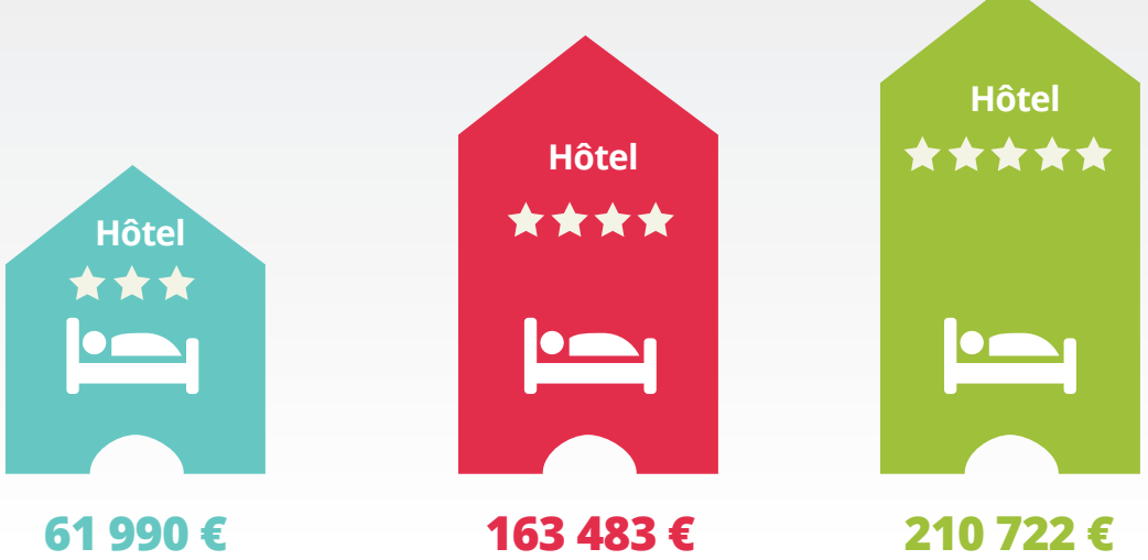
Chiffre d'affaires annuel moyen par établissement et par catégorie d'hôtels

C'est le chiffre d'affaires total annuel , généré par les 521 hôtels de l'étude, sur l'année 2022.