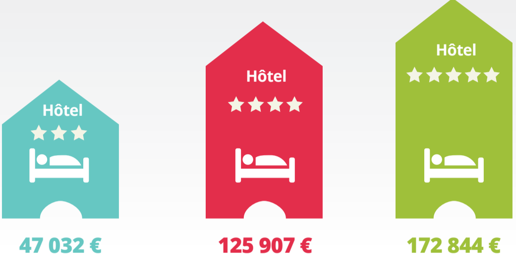
Chiffre d'affaires annuel moyen par établissement et par catégorie d'hôtels

57 495 530 € C'est le chiffre d'affaires total annuel , généré par les 491 hôtels de l'étude, sur l'année 2021.